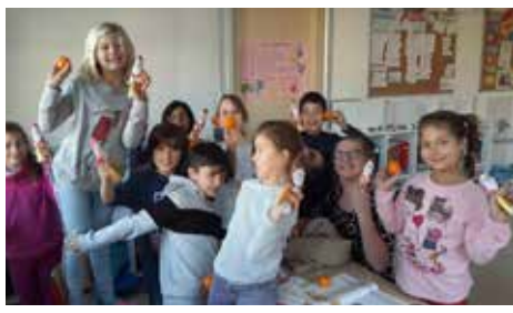
Das beste Nikolausgeschenk der Welt. Mandarinen? Echt?

Am 6. Dezember war der Nikolaus in der Schule. Alle Kinder der Grundschule haben jeder einen grossen Schokonikolaus bekommen. Aber wer war eigentlich der Nikolaus? Und war er wirklich da? Leider liess sich diese Frage nicht genau beantworten, weil der Mann mit der roten Mütze sich gar nicht gezeigt hat. Und so werden wir und viele der kleinen