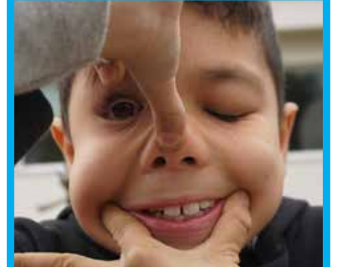
GRIMASSE DES MONATS

In der Bibliothek wurde am 23. Jan eingebrochen. Es wurde nichts gestohlen.