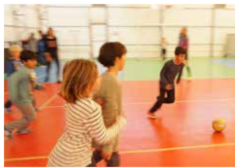
Das Projekt Fußball gab kleinen und großen Kindern die Möglichkeit ihre Geschicklichkeit am Ball zu üben.

und das Kindergartenthema Gelb, Rot, Blau waren auch mit dabei. Am Samstag, den 26.11. gab es von 10 bis 13 Uhr einen Präsentationstag zu dem alle Eltern und Teilnehmer eingeladen wurden. Es wurde erklärt und stolz gezeigt, vorgeführt, verkauft und gelacht. Wir freuen uns schon auf nächstes Jahr.