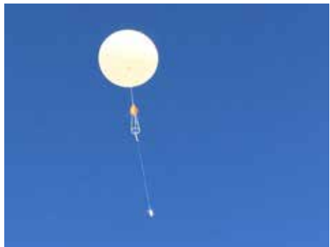
Gute Reise, Wetterballon...

Am 11. November machten die Klassen 3 und 4 einen Ausflug nach Izmir zur Wetterstation. Dort lernten wir wie z.B. das Wetter entsteht. Uns wurden viele verschiedene Instrumente zur Wettermessung gezeigt und