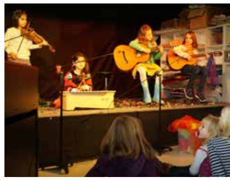
Jede Projektgruppe mußte am Samstag ihr Projekt der letzten 3 Tage präsentieren.

Unter dem Motto „Kinder für Kinder“ fanden auch dieses Jahr wieder die Projektstage an der DS-I statt. Dieses Jahr übernahm die Klasse 11 zusammen mit der Schulleitung die Organisation und alle Kinder wurden ermutigt eigene Projekte anzubieten. Insgesamt wurden 12 Projekte gewählt. Es gab viel Auswahl: von Fussball bis Fossilien, von Turnen bis Tanz, von Batik und Bleaching bis zum UNICF Projekt. Musik